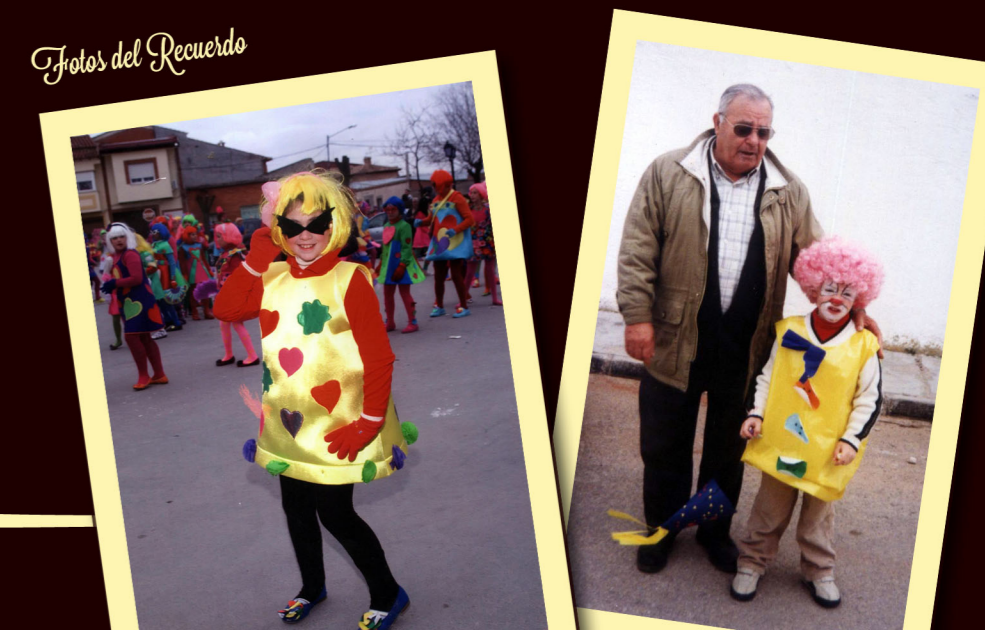
Fotos del Recuerdo