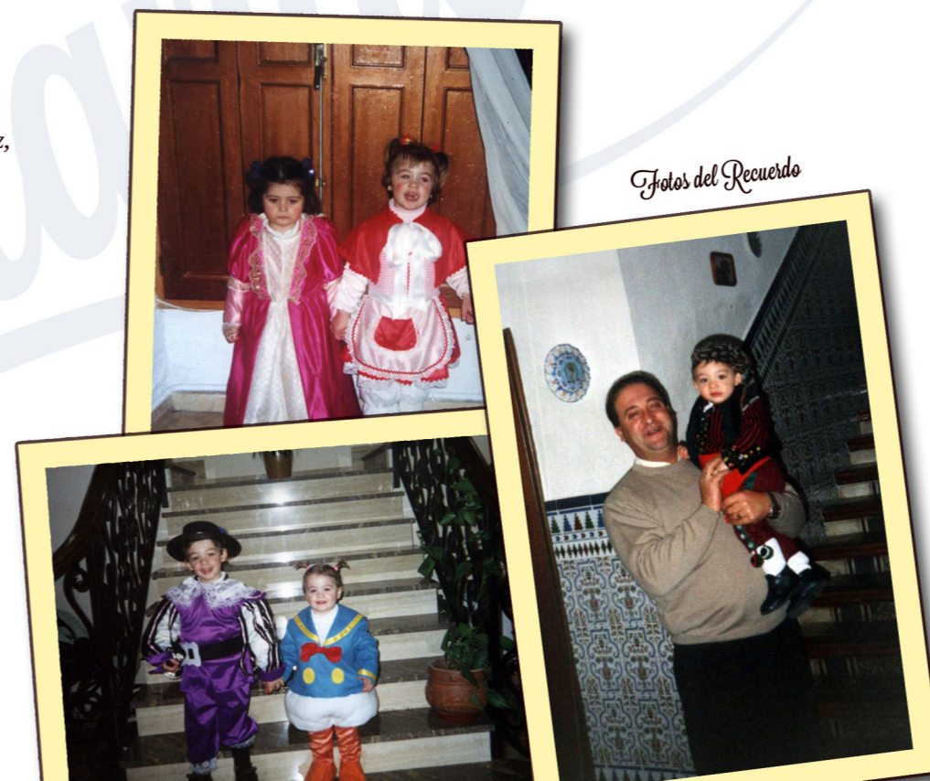
Fotos del Recuerdo

11' 00 h: Pasacalles a cargo de la Banda de Música Municipal Santa Cecilia. 12' 00 h: Misa Solemne con asistencia de los Capitanes. 13' 00 h: Corro de Carnaval y Baile de la Jota Pujada. 13' 30 h: Baile del Vermuth y fiesta de la Tapa Manchega amenizada con el duo 24 horas y media. Precios populares. 16' 00 h: Corro en el Parque Ofrecimiento de la Ánimas y posterior subasta. Baile de la Jota Pujada. Al final del Corro tendrá lugar una invitación de despedida a los Capitanes en la Carpa de Carnaval. 17' 00 h: Entierro de la Sardina, con salida desde la carpa a ritmo de Charanga recorriendo las calles..... (se ruega asistencia a las comparsas) Y despedimos a Don Carnal al ritmo del mejor son con 24 horas y media. 19' 00 h: Actuación musical a cargo del DUO BAILOGO en la Carpa como clausura del Carnaval 2012.