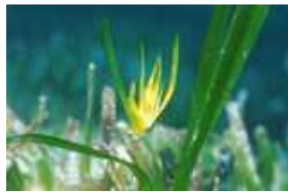
Flor de posidonia

En Otoño , debido a los primeros temporales habituales al final del verano, cuando el agua empieza a enfriarse, la planta pierde las hojas verdes. Fruto de estos temporales, se producen las características afluencias de toneladas de hojas muertas a las playas , las cuales juegan un papel determinante en la protección de la playa .